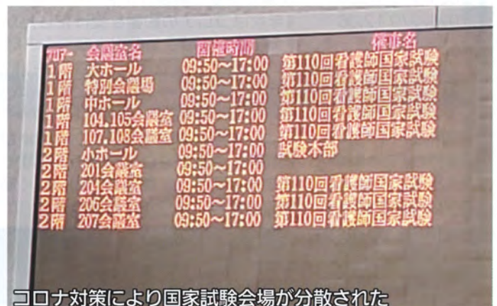
コロナ対策により国家試験会場が分散された