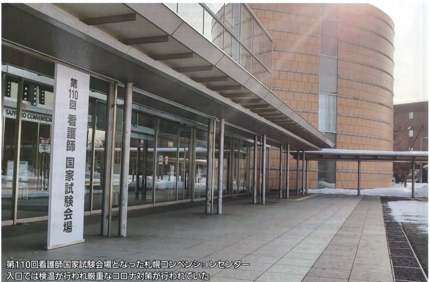
第110回看護師国家試験会場となった札幌コンベンションセンター 入口では検温が行われ厳重なコロナ対策が行われていた

新型コロナウイルス感染症に加え前日夜には福島沖地震が発生。第110回看護師国家試験は今までにない厳しさの中で行われました。本号では、この国家試験に立ち向かった第19期生の皆さまの声をお届けします。【コメントは原文のまま掲載します。誤字等につきましてはご了承下さい】