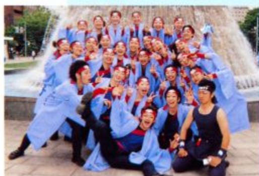
「薄荷童子に参加している本学学生27名」

したが、悔いなく心から楽しく踊れ完全燃焼し、最後の本祭を笑顔で踊りきりました。四年間このチームで踊り続けて本当に良かったと思いました。