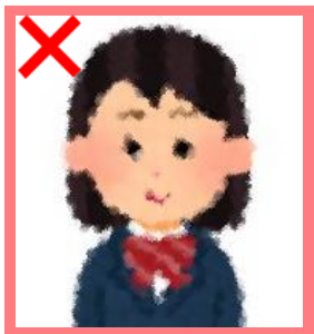
ピントが合っていない (画像が粗い)