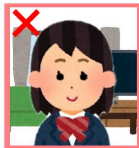
背景に家具等が 映っている