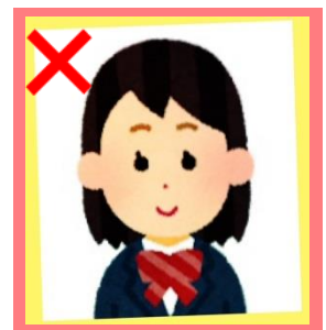
証明写真の再撮影 写真の修正・加工